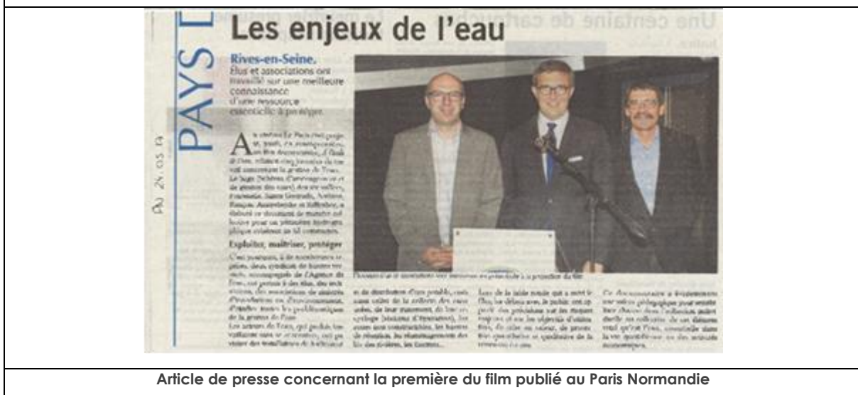
Article de presse concernant la première du film publié au Paris Normandie