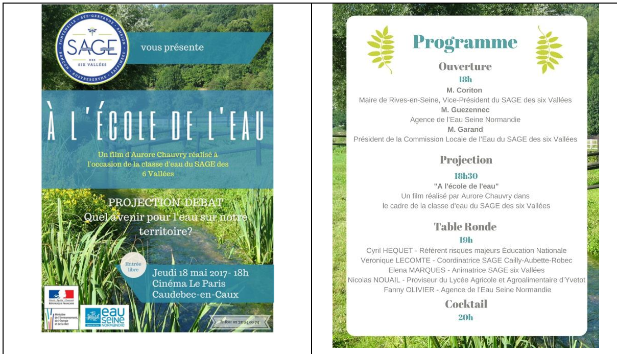
Affiche du film « A l'école de l'eau » et programme de la soirée

Le film a ensuite été mis en ligne sur YouTube. Les différents chapitres ont été partagés sur les réseaux sociaux. Lien du film : https://www.youtube.com/watch?v=-iQWUcgda30