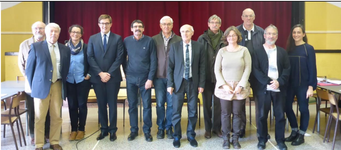
Figure 68 : Le bureau de la Commission Locale de l'Eau.